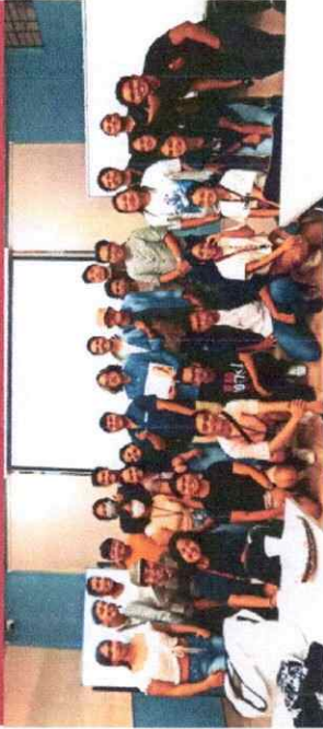
Monico Atienza Lecture Series (MAIS) ng Larangan ng Philippine Studies

UP-aiKa (Sasailigan Para sa Ikaunlad ng Kamalayang mata-Araling Pilipino)